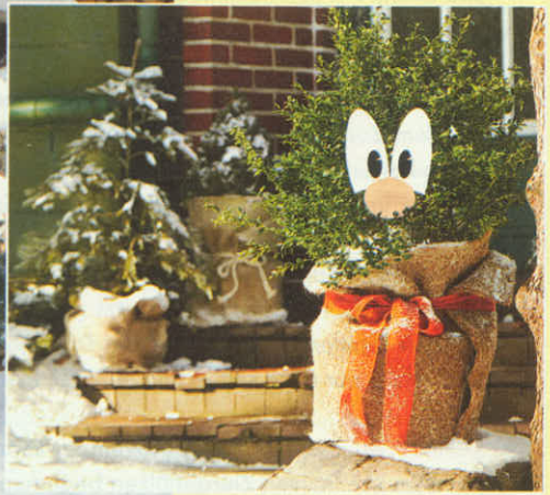
EINGEMUMMELT Der Jutesack schützt den Buchsbaum vor dem Frost, das Moosgummi-gesicht macht gute Laune

WARM EINGEPACKT Was ist denn das? Haben sich hier etwa einige Waldbewohner in die heimischen Gärten aufgemacht? Nein, hier handelt es sich lediglich um originell verpackte Sträucher. Pflanzen und Bäume sehen nämlich nicht nur im Sommer gut aus, sondern können jetzt auch im Winter mit den neuen Winterschutz-Motivsets von Videx lustig dekoriert und frostfest verpackt werden. Die Säcke aus wärmendem Vlies gibt es in zwei unterschiedlichen Größen. Enthalten sind in dem Set zudem noch ein Gesicht aus selbstklebendem Moosgummi, das auch ohne den Sack an den Zweigen befestigt werden kann. In Kombination dazu enthält das Paket Jutesäcke und Matten aus verschiedenen Naturmaterialien wie Stroh oder Cocos, die vor Kälte, Wind, Schnee und Sonne schützen