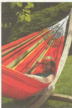
Hängematte Flora mit Streifenmuster.

Ein typisches Merkmal brasilianischer Hängematten sind die zu einem wunderschönen Makrameenetz geknüpften Endungen. Diese bewirken durch eine perfekte Verteilung des Gewichts auf die Aufhängeschnüre optimalen Liegekomfort, verspricht das Unternehmen Für ein Plus an Bequemlichkeit sorgt die diagonale Dehnung des Stoffes. Eine weitere Besonderheit der Linie Marés seien die farbigen Aufhängungen.