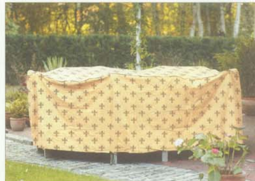
Schutzhaube „Lilie“ – hier für einen runden Tisch.