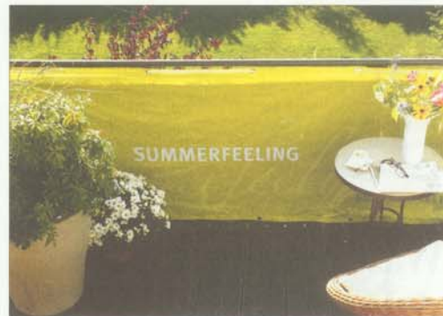
Bietet Schutz vor ungewollten Blicken: Balkonbanner „Summerfeeling“.

Kontakt: Videx Meyer Lütters GmbH & Co. KG, Hoher Weg 52, 27211 Bassum, Tel.: 04241-9221-0, E-Mail: office@videx.de, Internet: www.videx.de. (ts)